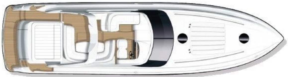
Upper accommodation layout