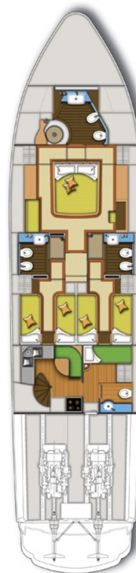
Leonard 72 – layout