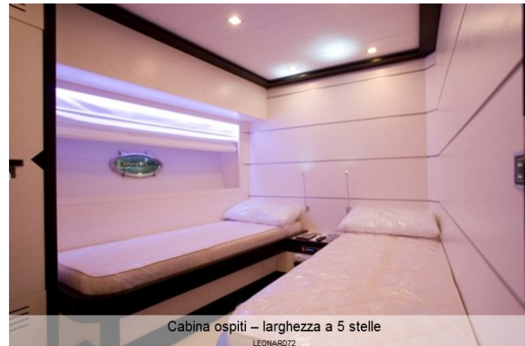
Cabina ospiti – larghezza a 5 stelle LEONARD72