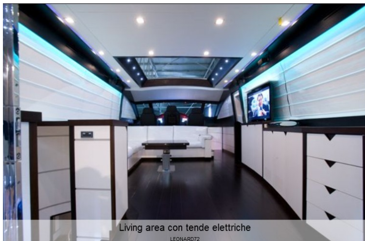
Living area con tende elettriche LEONARD72