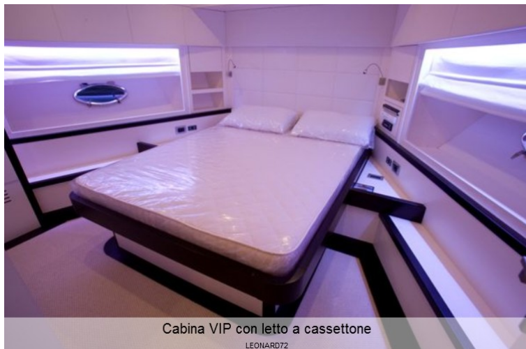
Cabina VIP con letto a cassettone LEONARD72