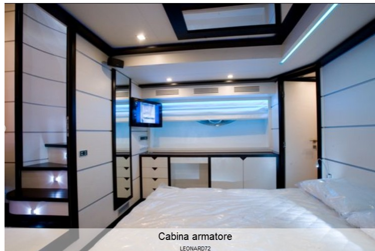
Cabina armatore LEONARD72